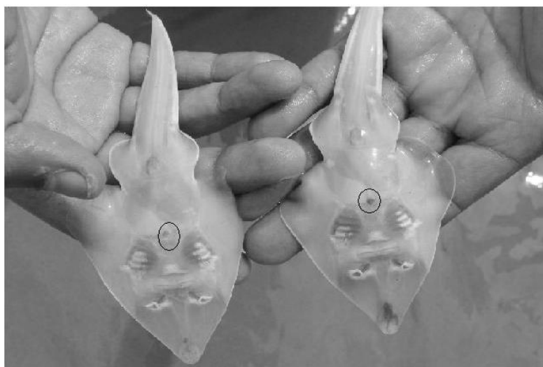
Figura 3: Rhinobatos percellens com destaque para a cicatriz umbilical (detalhe em preto) capturada incidentalmente pelo arrasto de camarão no município de Caiçara do Norte (RN) no janeiro de 2008 a julho de 2009.

Para Gymnura micrura (YOKOTA & LESSA, 2006); Dasyatis guttata (YOKOTA & LESSA, 2006); Rhinobatos percellens (BARBOSA, 2006); Narcine bancroftii (BIGELOW & SCHROEDER, 1953); Rhinoptera bonasus (BIGELOW & SCHROEDER, 1953), Aetobatus narinari (BIGELOW & SCHROEDER, 1953) foram observadas as marcas da cicatriz umbilical (Figura 3), possibilitando a classificação do estágio de desenvolvimento de cada espécime, havendo alta representação de neonatos e jovens nas capturas. A amplitude de comprimentos para as espécies de raias capturadas incidentalmente estão apresentadas na tabela 1. A alta proporção de neonato e jovens capturados se deve não só à baixa seletividade do aparelho de pesca utilizado, mas também pelo fato de a área ser utilizada como berçário por pelo menos 12 espécies de elasmobrânquios (YOKOTA & LESSA, 2006).