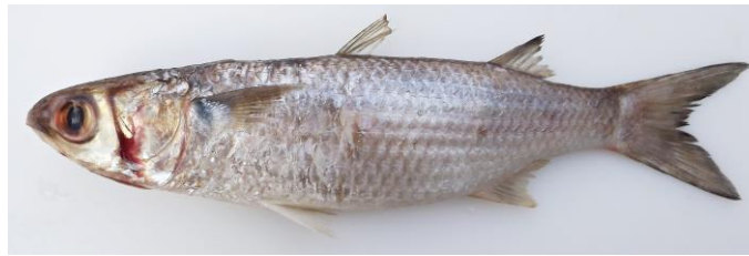
Figura 2. Exemplar de Mugil curema , 26,5 cm CT.

jovens). Nadadeira caudal furcada. Coloração do corpo prateada nas laterais e ventre claro, com dorso escurecido. Apresenta uma mancha escura na base da nadadeira peitoral, mais evidente do lado interno.