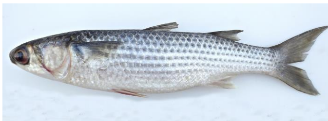
Figura 5. Exemplar de Mugil liza , 33,7 cm CT.

Conhecida popularmente como tainha-curimã (figura 5), apresenta o corpo alongado e fusiforme, com escamas tipo ciclóides (lisas ao tato); 29-36 escamas em séries laterais (sendo comum para a espécie entre 30-34 escamas). Nadadeira peitoral com 1 raio dividido e 14-16 raios ramificados; anal com 3 espinhos e 8 raios. Nadadeira caudal levemente lunada. Coloração do corpo prateada nas laterais em tom azulado, com dorso mais escuro. Apresenta estrias longitudinais escuras que passam pelo centro das escamas e se estendem da cabeça até o pedúnculo caudal, sendo menos nítidas na metade inferior do corpo, desaparecendo na região ventral do corpo que apresenta coloração esbranquiçada.