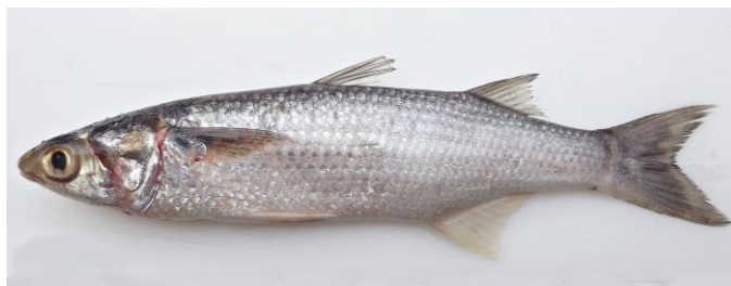
Figura 4. Exemplar de Mugil incilis , 23,5 cm CT.

Coloração do corpo prateada, com dorso mais escuro. Mancha negra bem evidente atrás da base da nadadeira peitoral.