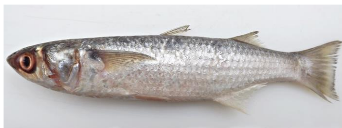
Figura 3. Exemplar de Mugil gaimardianus , 23 cm CT.

Conhecida popularmente como tainha-pitiu (figura 3), apresenta o corpo alongado coberto com escamas ctenóides (ásperas ao tato); 35-38 escamas em série laterais. Nadadeira dorsal com 4 espinhos e a segunda com 1 espinho e 8 raios; nadadeira anal com 3 espinhos e 9 raios. Ponta da nadadeira peitoral alcançando ou ultrapassando (nos exemplares adultos analisados) a vertical traçada a partir da origem da primeira nadadeira dorsal. Nadadeira caudal lunada com a ponta dos raios enegrecidos. Coloração do corpo prateada mais escura no dorso e coloração dourada em torno da órbita ocular. Nadadeira anal esbranquiçada. Apresenta uma mancha escura na região superior da base da nadadeira peitoral, mais evidente do lado interno.