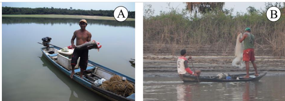
Figura 2. Embarcações utilizadas pelos pescadores nos lagos Mapiri e Papucu, Santarém, Pará: (A) canoa de madeira com motor do tipo “rabeta” utilizado como propulsor e (B) bote ou cascos movidos à remo.

As embarcações são desprovidas de equipamentos de orientação à navegação; somente 7% não usam equipamento de segurança e 93% afirmaram utilizar pelo menos coletes e/ou coletes e boias. A tripulação é composta por uma ou duas pessoas, dependendo do tamanho do barco, sendo que 63% deles pescam com um companheiro, geralmente, um parente (filho, esposa, cunhado) ou amigo (Figura 2B).