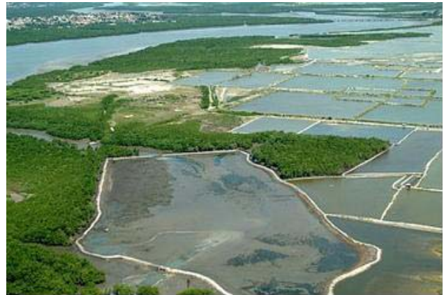
Figura 9 – Carcinicultura do Nordeste brasileiro

No final de 2004, apenas cerca de 17.000 ha eram utilizados em maricultura, sendo que mais de 82% para a produção de camarão (carcinicultura) (Figura 9), que teve uma produtividade de apenas 75.000 t, ficando a produção de ostras, mariscos, vieiras, peixes e caranguejos, com produtividade de apenas 13.000 t.