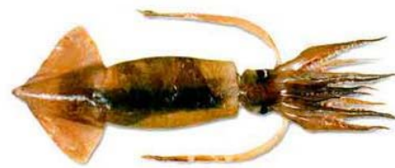
Figura 4 - Calamar argentino Illex argentinus