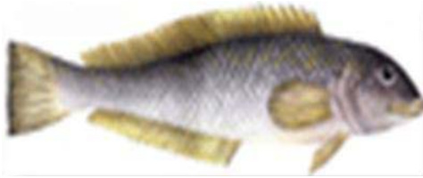
Figura 8 – Namorado Pseudopersis numida

Usada apenas em zonas estuarinas, a passiva técnica do emalhar está