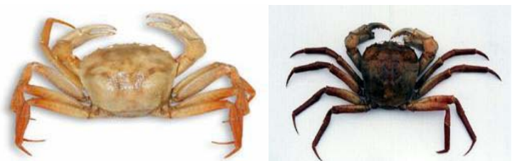
Figura 6 - Caranguejo-real Chaceon ramosae (Esquerda) e caranguejo-vermelho C. notialis (Direita)

As armadilhas servem para a captura de peixes e de crustáceos. E essas operações podem ser feitas a mil metros de profundidade, no caso dos caranguejos real ( Chaceon ramosae ) e vermelho ( C. notialis ) (Figura 6), cuja biomassa abundante foi descoberta pelo REVIZEE.