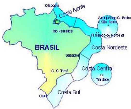
Figura 2 - Subcomitês Regionais do REVIZEE

Em cada uma dessas regiões, a coordenação e execução do Programa ficaram a cargo de um SCORE, formado por representantes das instituições de pesquisa locais e contando, ainda, com a participação de membros do setor pesqueiro regional.