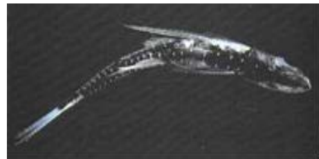
Figura 3 - Peixe-lanterna Maurolicus stehmanni

Dentro desse grupo de estoque potencial, o REVIZEE fez outras descobertas. A anchoíta ( Opisthonema oginum ) ocupa a plataforma continental em abundância considerável, no extremo Sul, e moderada, no Sudeste. Sua ampla distribuição e facilidade de captura tornam essa espécie um recurso importante, mas ainda sem aproveitamento no Brasil, apesar de apresentar potencial para a obtenção de concentrados protéicos. Dificuldades de conservação e falta de mercado têm sido apontados como fatores impeditivos à sua exploração.