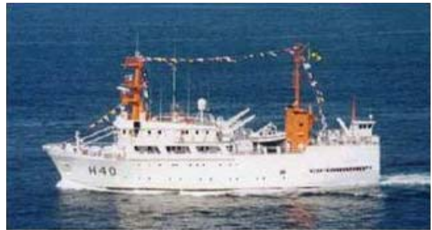
Figura 10 - Navio Oceanográfico Antares – participou ativamente do REVIZEE

O acompanhamento do esforço de pesca ao longo do litoral brasileiro deverá ser mensurado a partir dos seguintes dados: quantificação dos desembarques totais, localização das áreas de captura e registro das condições de comercialização do pescado, conforme descreve a Proposta Nacional de Trabalho do Programa REVIMAR, baseada nas recomendações do REVIZEE.