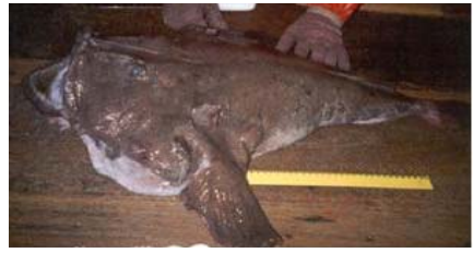
Figura 7 - peixe-sapo Lophius gastrophysus

Polyprion americanus ), o peixe-sapo ( Lophius gastrophysus ) (Figura 7) e o namorado ( Pseudopersis numida ) (Figura 8), por exemplo, são capturados pelo mesmo sistema, mas bem mais fundo, a 600 metros de profundidade, em média.