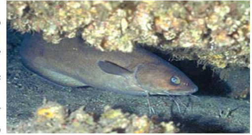
Figura 5 - Abrótea-de-profundidade Urophycis mystacea

A merluza ocorre desde a Patagônia, Argentina, no Sul do continente, até o Sul do estado do Espírito Santo. Ela é mais abundante no talude superior, a partir dos 300 metros de profundidade. Na região Nordeste, os grupos de atum também fazem parte da lista das consideradas surpresas positivas. O estoque desses peixes e de seus derivados (afins), de alto valor comercial, apresenta grande potencial para exploração.