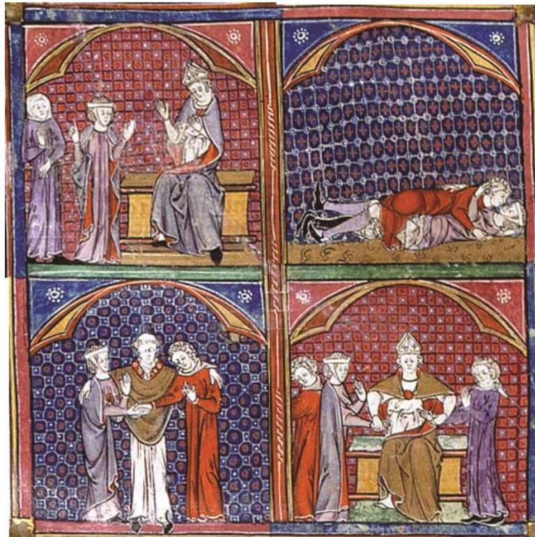
Imagem 2: Decretum de Graciano, ms 262, fólio 86v, Fitzwilliam Museum, Cambridge, Inglaterra

Percebe-se que a história narrada em quatro quadros é relativamente confusa. Começando com três personagens, ao que parece há uma mulher ao centro, gesticulando com uma das mãos apontando para um personagem masculino à esquerda. A outra mão aparece com a palma aberta em direção a um clérigo. A ideia fixada na iconografia sugere que se trata da esposa imputando ao marido algum delito. Pelos gestos manuais dela, parece que a esposa argumenta a seu favor, contra o esposo. Sabemos pelo texto da causa 33 que não se trata de um crime, mas da impotência do marido que não conseguiu consumir o casamento. Mesmo que as imagens não possuam legendas, imaginamos que a miniatura narrada começa, então, com a denúncia e o pedido de anulação da união matrimonial.