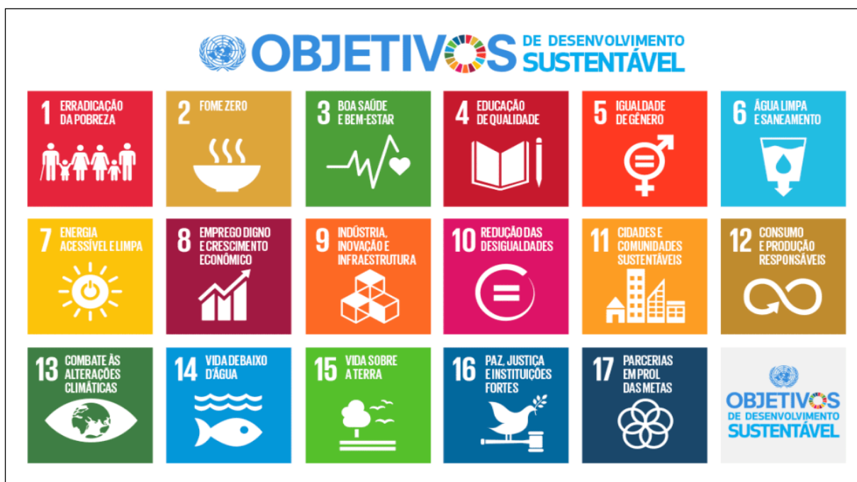
Figura 1. Representação dos Objetivos de Desenvolvimento Sustentável (ODS)