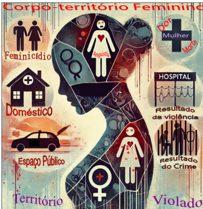
Figura 1. Corpo como Território Violado