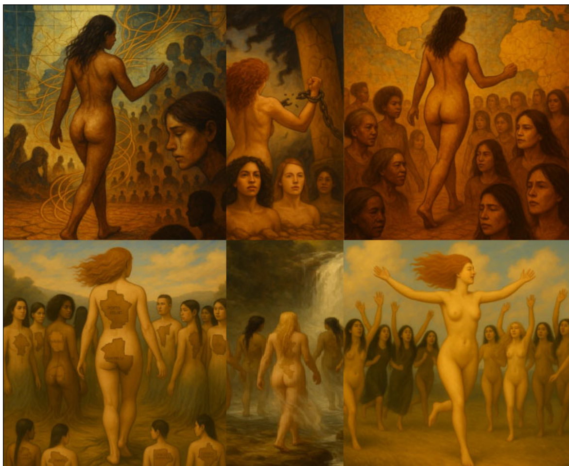
Figura 6. Cartografia da reconstrução e a vida longe do agressor