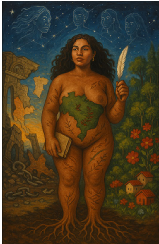
Figura 5. Cartografia do abrigo como território de reparação e reconstrução