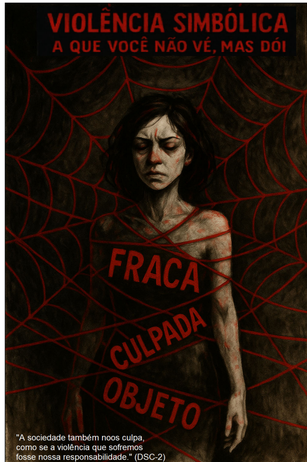
Figura 2. Cartografia da Culpabilização da Vítima