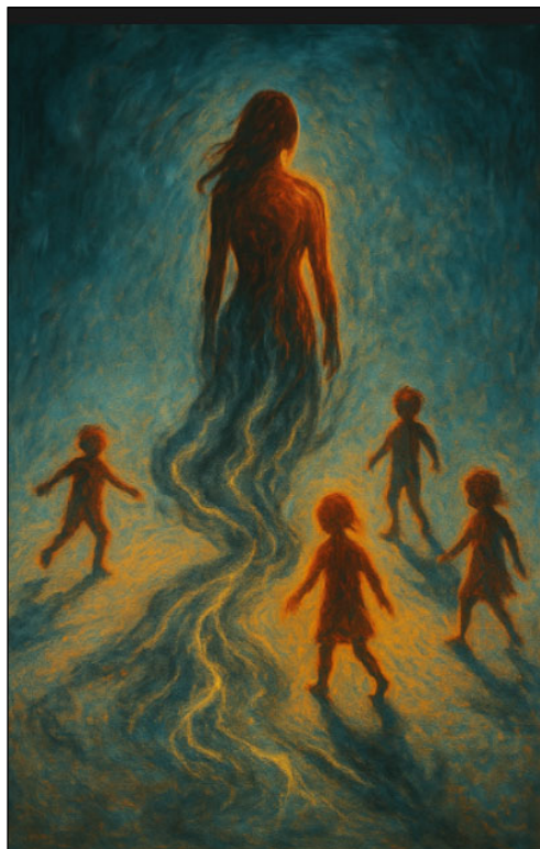
Figura 4. Cartografia afetiva do trauma intergeracional