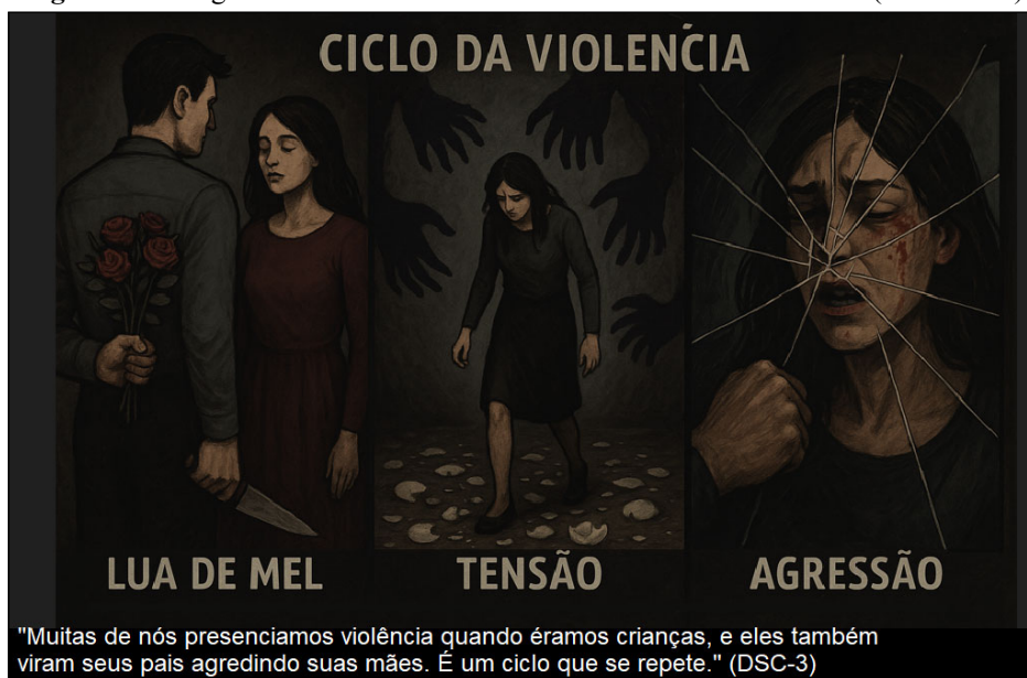
Figura 3. Cartografia da violência vivenciada como Processo Contínuo (Continuum)

Fonte: Elaborado pelas autoras (2025), com apoio da ferramenta de IA ChatGPT (modelo GPT-5).