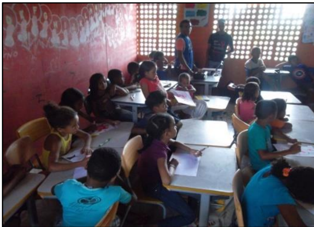
Figura 2. Palestra com alunos na escola no município de Aldeias Altas. MA.

A presença de crianças, jovens e adultos nas escolas com diferentes faixas etárias permitiram ser realizadas diferentes tipos de atividades para a transmissão do conhecimento. Para as crianças de 6 a 12 anos, houve a exposição de vídeos e proferidas palestra e seminário sobre reciclagem e a importância da preservação do meio ambiente ( Figura 2 ).