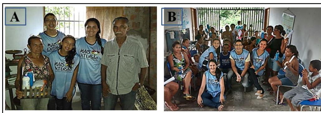
Figura 6. Finalização do projeto na U. E. Taboca Matão e E. M. Desidério Alves dos Santos, Projeto Mais Extensão no povoado Taboca Matão e jatobá em Aldeias Altas, MA. A - Ganhadora do kit de reagentes químicos para fabricação de sabão caseiro e B - Distribuição de desinfetantes e de barras de sabão caseiro de coco para o público presente e para a escola.