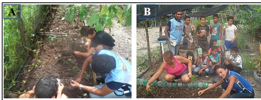
Figura 4. Plantio de hortaliças na U. E. Taboca Matão e E. M. Desidério Alves dos Santos do Projeto Mais Extensão no povoado Taboca Matão em Aldeias Altas, MA. A - Distribuição de sementes de verduras e legumes para plantio e B - Plantio de sementes de verduras e legumes em geral.

Posteriormente nas escolas foram realizadas conjuntamente com os alunos o plantio de hortaliças, com a distribuição de sementes de verduras e legumes em geral. Durante a realização do plantio foi repassado aos alunos à importância de se cultivar hortaliças, e os benefícios que o plantio pode trazer para escola, as famílias e a comunidade ( Figura 4 A-B ) e na melhoria da qualidade de vida.