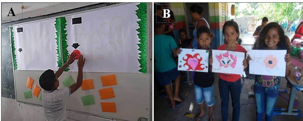
Figura 3. Oficinas nas escolas no município de Aldeias Atlas, com crianças entre seis a 12 anos. A - Trilha ecológica após palestra sobre preservação do Meio Ambiente e B - Confeção de Matérias com uso de EVA e papeis coloridos.

A realização de oficinas nas escolas envolveu crianças entre seis a 12 anos, sendo confeccionado objetos através de matérias descartáveis oriundo do lixo. As crianças foram levadas para uma sala onde produziram porta objetos reutilizando garrafas pets e materiais adquiridos pela equipe como: E.V. A, cola quente, tintas para tecido, tesouras, papéis, estiletes, pinceis artístico e atômico, entre outros, como bolsas reutilizando caixa de leite e retalhos de tecidos ( Figura 3 ).