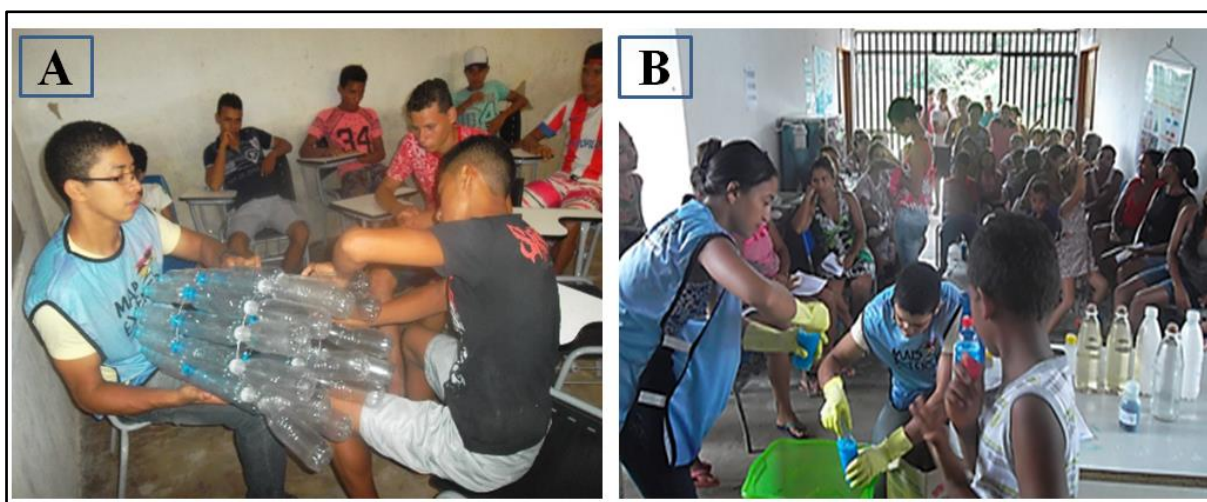
Figura 5. Realização de oficina para confecção de objetos através de matérias descartáveis oriundo do lixo na U. E. Taboca Matão, do projeto mais extensão no município de Aldeias Altas, MA. A - Montando um cesto de lixo por meio de garrafas pets e B - Confecção de sabão pela comunidade.

Nas oficinas para jovens e adultos, foram construídas vassouras e poltronas provenientes de materiais produzidos de lixo doméstico com garrafas pets e bolsas utilizando caixas de leite. Posteriormente ocorreu a fabricação de desinfetante e sabão caseiro de coco pela reutilização de óleo provenientes do uso das cozinhas ( Figura 5 A-B ). Ao término foi realizado sorteio de um kit de reagentes químicos para fabricar desinfetante e outro kit para fabricar sabão caseiro, e distribuídos recipientes com desinfetantes e barras a comunidade ( Figura 6 )