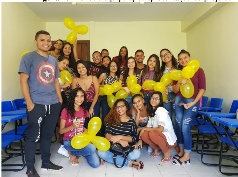
Figura 1: Alunos e equipe após apresentação do projeto.