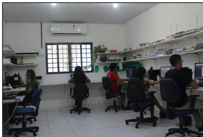
Figura 6. Instalações do LabMarketing.