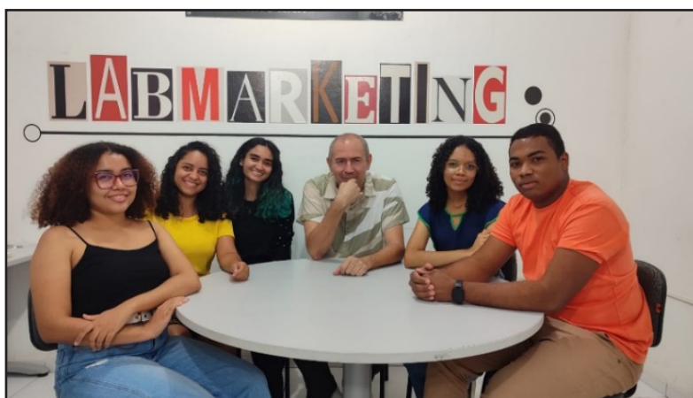
Figura 5. Equipe de produção do projeto Campus na mídia.

Além do professor coordenador, o projeto conta com seis colaboradores diretos para realizar essas atividades: a) uma profissional recém-formada em Letras, que atua como assistente da coordenação; e b) cinco alunos, sendo três de Letras, um de Administração e um de Análise e Desenvolvimento de Sistemas (Figura 5). Toda a equipe é mantida por meio de bolsas fornecidas pela UEMA e trabalha 20h/semanais, no período da tarde. O projeto também conta com vários alunos voluntários que atuam identificando notícias e coletando informações e imagens, que são enviadas para a equipe de produção do projeto. Esses voluntários são fundamentais para o projeto, pois não há como a equipe de produção, que trabalha à tarde, estar presente em todos os lugares a todo momento. Os alunos precisam ter habilidades técnicas e conceituais específicas em comunicação, como produção de notícias, captação de áudio, de imagens (celular, câmera fotográfica e microfones) e edição.